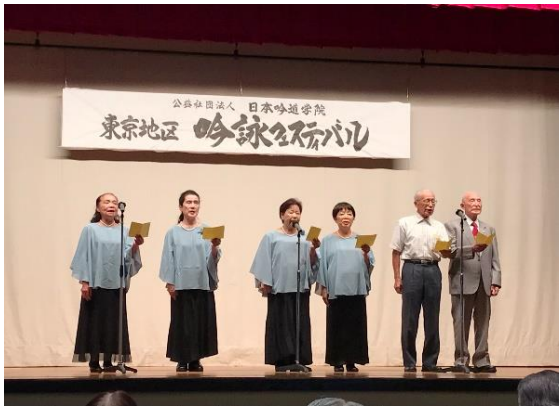
歌謡吟詠「故郷」合吟 吟詠フェスティバル