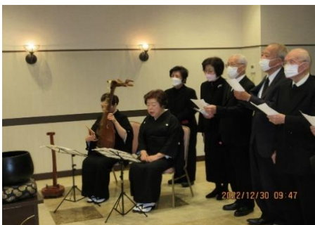
弔吟 理事長・会長・南洲吟道会一同 湊山さん愛用の琵琶「雅友」とともに

最後のメール「世の中には色々なことをなさる人がいるのですね。楽しい事はない事です。またさか・・・（何が言いたかったのかな？）して下さい。ありがとう。」又来世で会えますかね。名残りは尽きません。本当に互いに良き人生だったと思いたいです。良きご縁をありがとう。