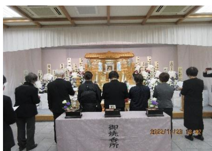
南洲吟道会一同による弔吟 通夜にて